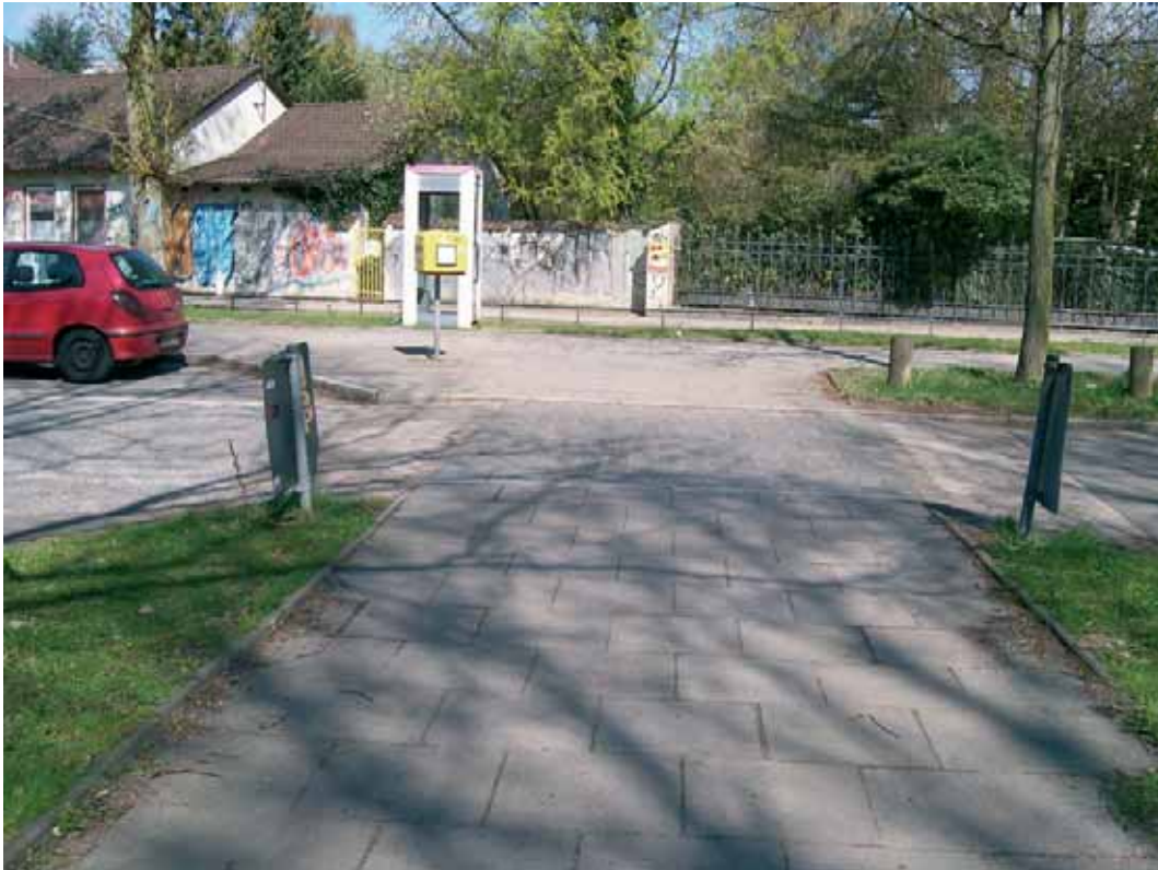
Direkter geradeaus könnte der Weg durch die dreieckige Grünfläche führen