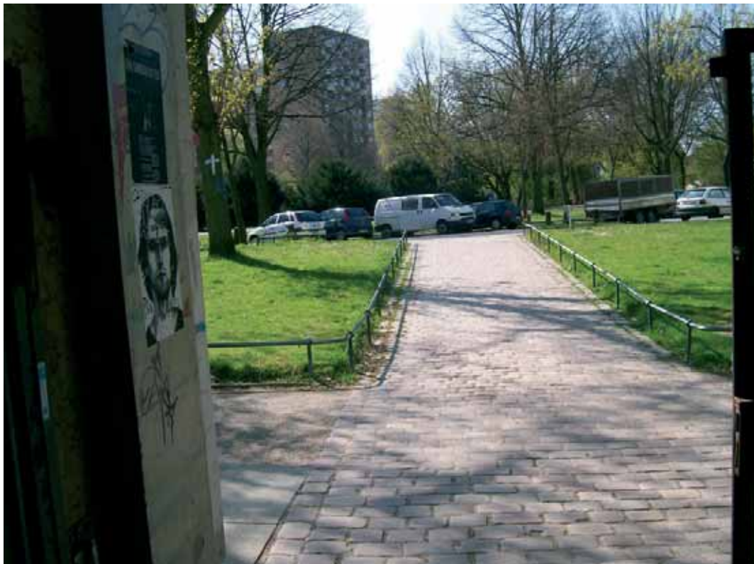
Parkausgang an der Thadenstraße

Fußgänger, die den Wohlerspark durch den südlichen Ausgang verlassen, werden über einen kopfsteingepflasterten Weg geradeaus direkt an die Fahrbahn der Thadenstraße geführt. An dieser Stelle befindet sich aber keine Querungshilfe, auf der südöstlichen Straßenseite behindern geparkte Kraftfahrzeuge die direkte Querung und der Bordstein ist nicht abgesenkt. Außerdem führt auf der südöstlichen Seite direkt im Anschluss an die Fahrbahn kein Weg in den