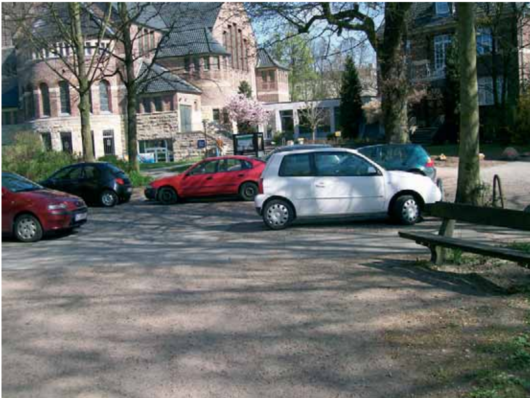
Zugeparkte Querung an der Suttnerstraße

An dieser Stelle wird eine kleine Nebenstraße gequert, auf welcher ein sehr geringes Verkehrsaufkommen herrscht und sich die Kraftfahrzeuge zum Zeitpunkt der Begehungen mit geringen Geschwindigkeiten bewegten. Vom fließenden Kraftfahrzeugverkehr gehen an dieser Stelle daher für Fußgänger wenige Gefahren aus. Allerdings zeigen Beobachtungen, dass hier ein sehr hoher Parkdruck herrscht, was dazu führt, dass auch der Querungsbereich häufig mit Kraftfahrzeugen versperrt ist. Dadurch kommt es zur Behinderung des Fußgänger-Querverkehrs sowie zu Sichtbehinderungen zwischen Fußgängern und sich auf der Fahrbahn bewegenden Kraftfahrzeugen. Einige Meter westlich der Querungsstelle steht das Gefahrenzeichen 136 StVO „Kinder“ mit einem darunter angebrachten Hinweisschild auf