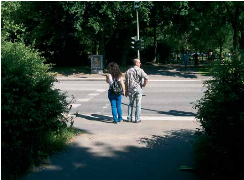
Um an die Bedarfsampel an der Königstraße zu kommen, stellen sich die Fußgänger auf den Radweg