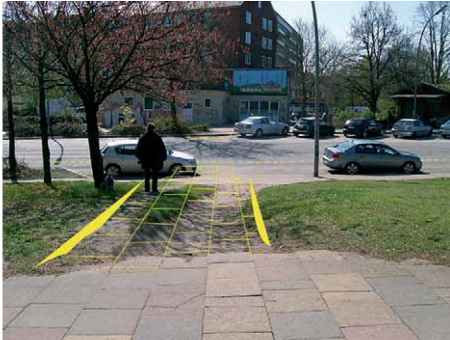
Der Trampelpfad muss befestigt werden

Radweg mit einem Schutzabstand zur Fahrbahn von einem Meter, auf welchem sich Fußgänger zum Warten aufstellen müssen. Auf beiden Straßenseiten wird die Querung durch am Straßenrand geparkte Kraftfahrzeuge behindert und die Bordsteine sind nicht abgesenkt. Auf der Fahrbahn dürfen Kraftfahrzeuge nur in einer Richtung fahren. Die Straße ist so breit, dass drei Kraftfahrzeuge nebeneinander fahren können. Während der Ortsbesichtigungen war das Kfz-Aufkommen allerdings nicht besonders hoch, weshalb auch ohne Berücksichtigung der querenden Fußgänger fraglich erscheint, ob diese Breite erforderlich ist.