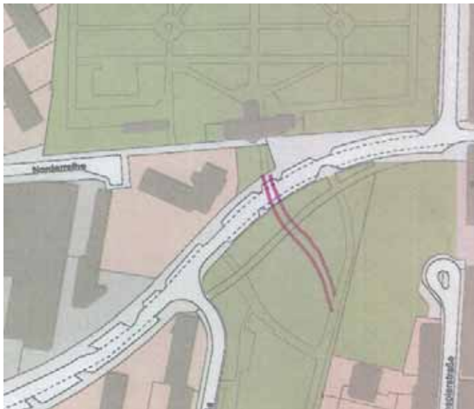
Weg vom Südausgang des Wohlersparks zum Grünzug: Ausschnitt aus Grundkarte mit eingezeichneter vorgeschlagener Wegführung