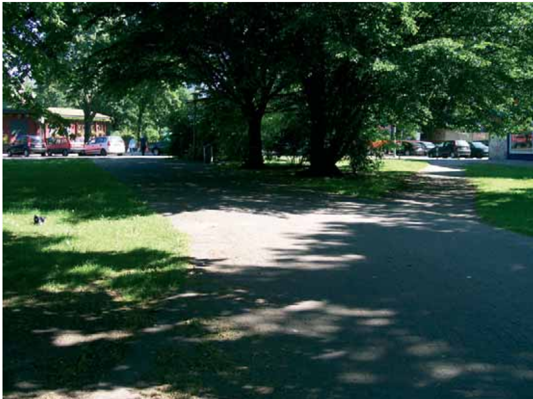
Südlicher Zugang zur Straße Nobistor

An der untersuchten Querungsstelle befindet sich auf der nördlichen Straßenseite ein Fußgängerkap, bei welchem allerdings der Bordstein nicht abgesenkt ist und auf welchem ein Baum, ein Findling sowie ein Schild zur Regelung des Parkens stehen und ein ungehindertes Passieren durch Fußgänger erschweren. Außerdem liegt das Fußgängerkap nicht im direkten Wegeverlauf, sondern einige Meter westlich davon. Auf der südlichen Straßenseite kommt es zu Sichtbehinderungen durch Fahrzeugüberhänge von auf dem Gehweg geparkten Kraftfahrzeugen. Während der ersten Ortsbesichtigung (23.4.10 ca. 11:45) hielt außerdem ein Kraftfahrzeug im direkten Wegeverlauf und behinderte somit den Fußgängerquerverkehr.