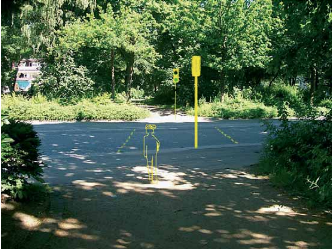
Empfehlung: Max-Brauer-Allee mit Fußgänger-Lichtsignalanlage

Benabschnitt angegeben. Die Fahrzeuge bewegten sich zum Zeitpunkt der Begehung mit sehr hohen Geschwindigkeiten, die zugelassene Höchstgeschwindigkeit beträgt 50 km/h. Die ungesicherte Querung birgt demnach für Fußgänger einige Gefahren. Es ist davon auszugehen, dass risikoscheue Fußgänger daher den Umweg über eine der Lichtsignalanlagen in Kauf nehmen und der Grünzug für sie dadurch an Attraktivität verliert. Rollstuhlfahrer müssen den Umweg über eine der Lichtsignalanlagen wählen, da im direkten Wegeverlauf beidseitig die Bordsteine sehr hoch sind.